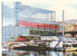
90 FRONTE MARE SEA FRONT