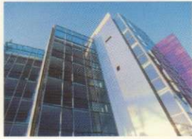
66 VELE RIFLESSE REFLECTED VEILS