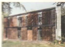
110 STUDIO VON GERKAN: PROGETTO CASA ALVANO STUDIO VON GERKAN: CASA ALVANO PROJECT