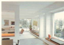
96 ATTICO A MILANO A TOP FLOOR FLAT IN MILAN