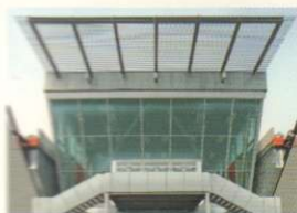
102 PASSAGGIO TRA VETRO ED ACCIAIO PASSAGE THROUGH GLASS AND STEEL