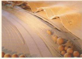
72 RENZO PIANO PER PAUL KLEE RENZO PIANO FOR PAUL KLEE