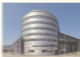
126 INTERVENTO A CUORE APERTO HEART MAKES ARCHITECTURE