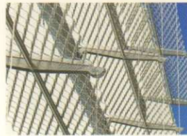
76 DELL'ACCIAIO E DELL'OMBRA STEEL AND SHADE