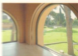
118 LE LUCI DELLA CASA DEL JAZZ THE LIGHTS IN THE JAZZ HOUSE