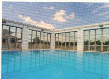
48 PISCINE OPEN AIR di Manuela Fiorotto

OPEN AIR SWIMMING POOLS by Manuela Fiorotto