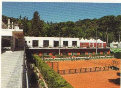
36 RINNOVATI EQUILIBRI di Stefano Ferracini

A "NEW" DANCE FOR AN OLD FOUNDRY by Manuele Elia Marano