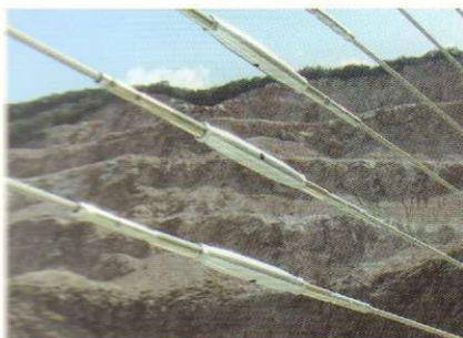
118 POINT LINE SURFACE® di / by Manuela Fiorotto

NEW ARCHITECTURES FOR THE DOGE'S PALACE by Marzia Urettini