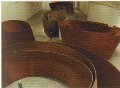
96 RICHARD SERRA AL GUGGENHEIM DI BILBAO di Marzia Urettini

RICHARD SERRA AT THE GUGGENHEIM IN BILBAO by Marzia Urettini