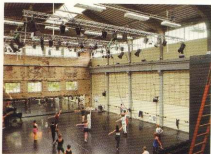
18 LA "NUOVA" DANZA DELLA VECCHIA FONDERIA di Manuele Elia Marano

A "NEW" DANCE FOR AN OLD FOUNDRY by Manuele Elia Marano