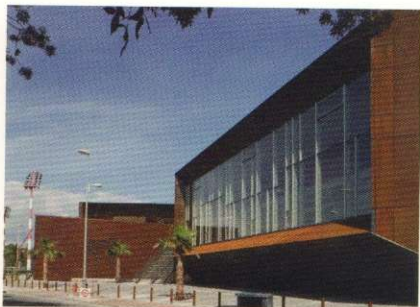
10 PALAIS OMNISPORTS - CANNES LA BOCCA di / by Marina Cescon