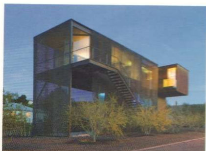
76 ARIZONA di / by Marina Cescon