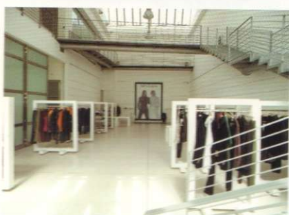
64 STEEL STYLE di / by Marzia Urettini

OPEN AIR SWIMMING POOLS by Manuela Fiorotto