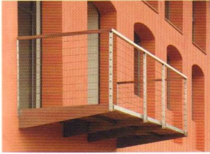
88 LOFT SULL'ARNO di Simone Scarselli