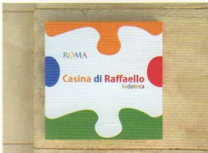
102 GIOCARE A VILLA BORGHESE: LA CASINA DI RAFFAELLO di Marina Cescon

RICHARD SERRA AT THE GUGGENHEIM IN BILBAO by Marzia Urettini