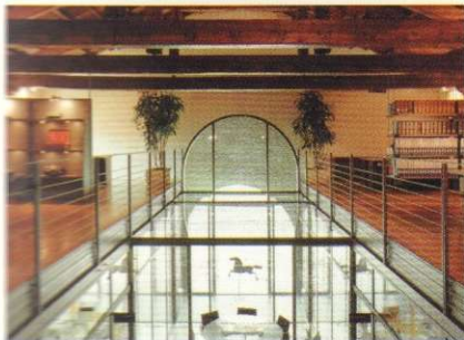
108 NUOVE ARCHITETTURE PER IL PALAZZO DUCALE di Marzia Urettini

PLAYING AT VILLA BORGHESE: THE CASINA DI RAFFAELLO by Marina Cescon